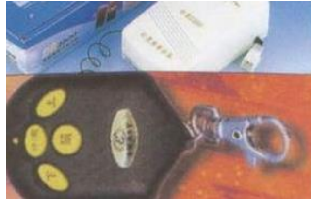
CONTROL REMOTO PARA PUERTA ENROLLABLE