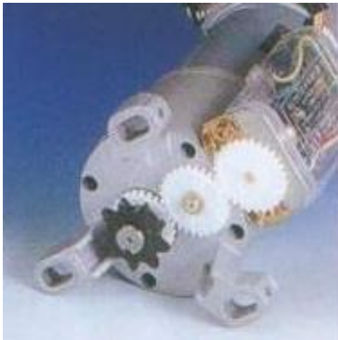
(ENLACE DE LA CADENA Y AUTO-ENSAMBLE)