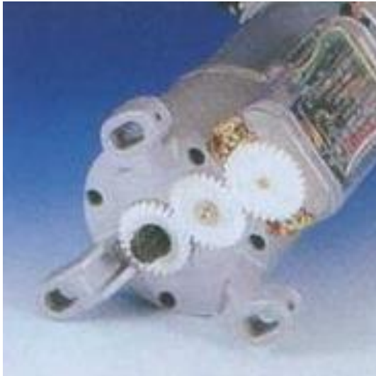
(EQUIPO Y MONTADO DE CADENAS)